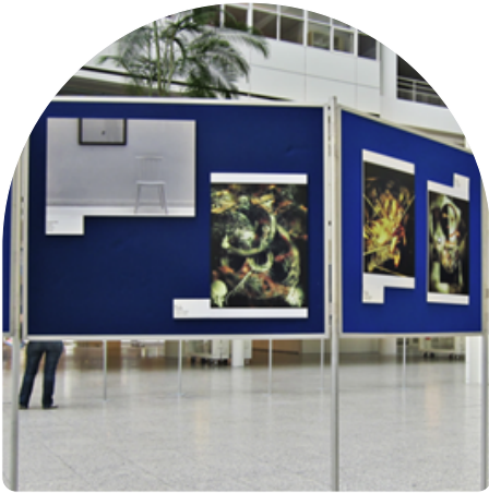
Voorbeeld van expositiepanelen