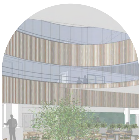
Impressie nieuwe situatie

In de afgelopen maanden zijn er verschillende informatiebijeenkomsten voor bewoners, hun naasten en medewerkers georganiseerd. Daarin is men geïnformeerd over de stand van zaken en wat de verbouwing gaat inhouden. Uit deze informatiebijeenkomsten is een klankbordgroep samengesteld.